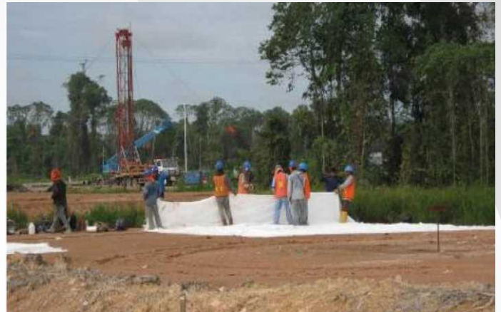
❖ Pembangunan Jalur Ganda (Lintas Utara), Cirebon, 2012